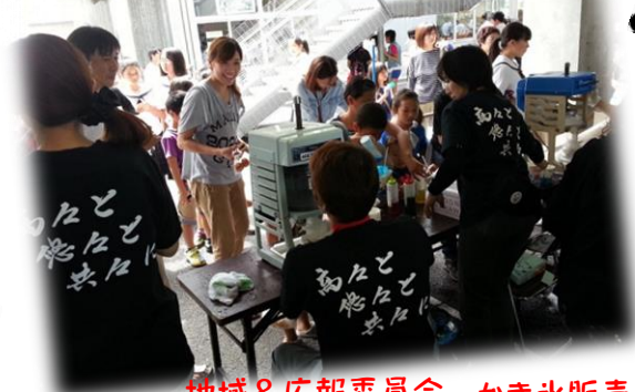
地域&広報委員会 かき氷販売