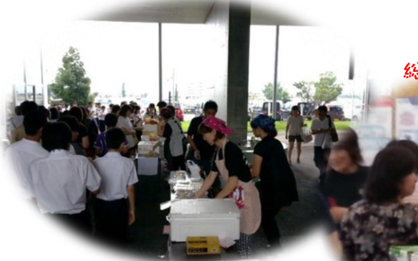
学級委員 クレープ・ケーキ販