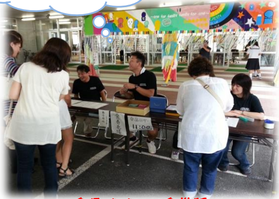
食品バザーの食券販